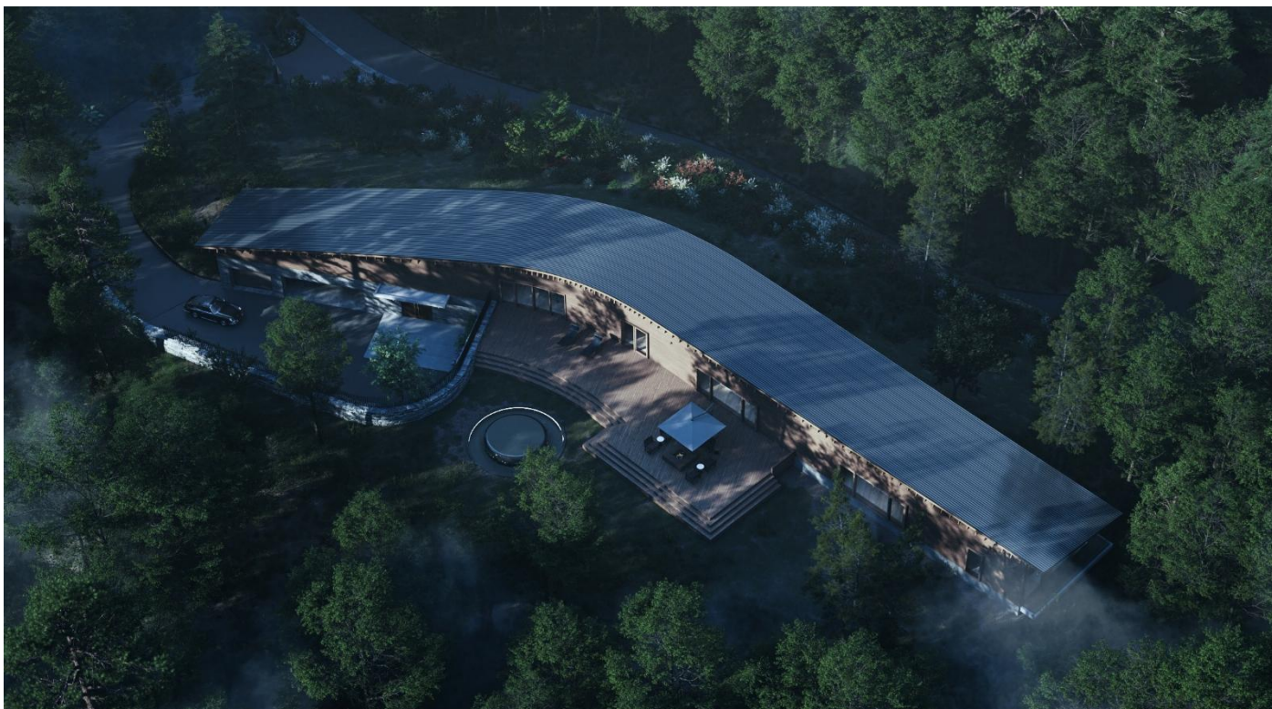
「Seren Collective OAK」：外観パース（鳥瞰）

本物件は、国際的プロジェクトを手がけた建築家・石田建太郎氏の設計により、軽井沢の豊かな自然と調和する建築として誕生しました。当社が展開する「Seren Collective」シリーズの3棟目となります。