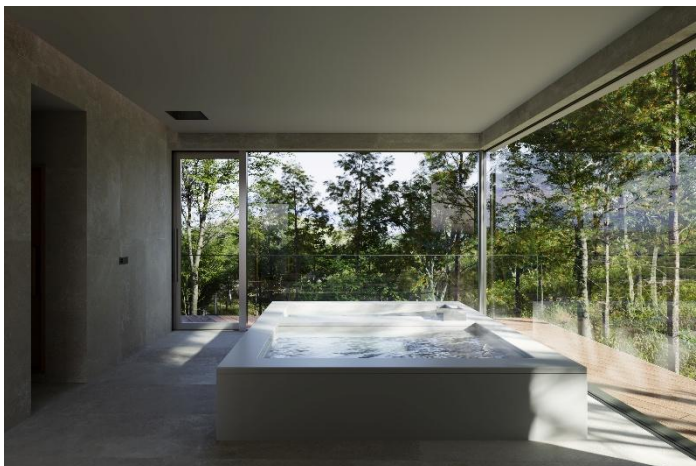
「Seren Collective OAK」：内観パース（左上：リビング、右上：テラス、左下：ダイニング、右下：バスルーム）