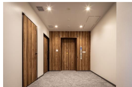
「VORT 西新宿 NEX」上：外観、中：内観、 下：内観エレベーター前（※2024年2月撮影）