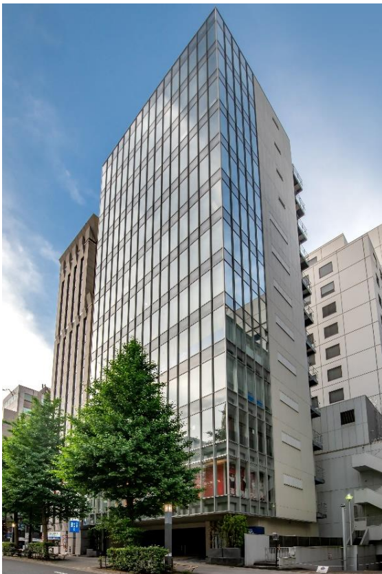
「VORT 西新宿Ⅲ」外観※2023年5月撮影

本物件は「渋谷」を代表する繁華街にあり、アートとカルチャーの発信地である宇田川町に位置しています。物件の近くには、再開発した商業施設のほか、日本を代表する大手IT企業がオフィス移転するなど、新たなビジネス街として変貌を遂げているエリアです。また、徒歩9分以内に7路線と複数の路線が利用可能で利便性の高さが魅力です。本物件の外観は白を基調としており、ガラス張りが特徴的な視認性のよい物件で、事務所や飲食店舗など幅広い用途での需要が見込まれます。