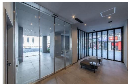
『VORT 神保町IV（仮称）』上：外観、中：ルーフテラス、下：エントランスホール