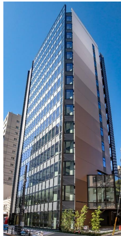
『VORT 六本木一丁目』外観