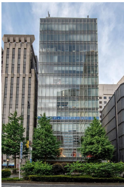
「VORT 西新宿Ⅲ」外観※2023年5月撮影

「浅草橋」駅まで徒歩1分、東京駅まで続く江戸通り沿いに面しています。周辺には、古くから続く人形問屋、手芸用品等を取り扱う問屋が軒を連ねています。近年は、住居やビジネスエリアとしても発展し、駅前には学習塾やシェアオフィスなどが出店しており新たな需要が見込まれます。本物件は、前面ガラス張りのスタイリッシュな外観、エントランスは木目調と石調のタイルをあしらひ、エレガントかつ優美さを感じさせます。「浅草橋」駅からの視認性もよく、テナント候補の目に留まりやすい物件です。