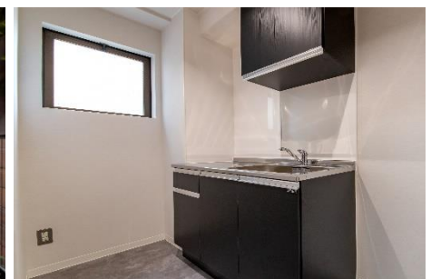
「VORT 芝公園Ⅲ」外観（上段）、6階（中段左）、10階（中段中）、レストルーム（中段右）、エレベーターホール（下段左）、エントランスホール（下段中）、給湯室（下段右）※2022年6月撮影