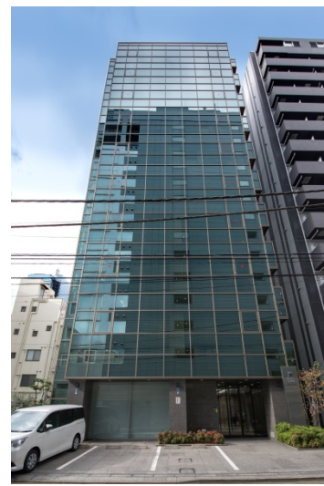
◇エネルギー消費量削減の認証により資金調達をする物件（左から VORT 南青山 I、VORT 銀座イースト、VORT 芝大門）