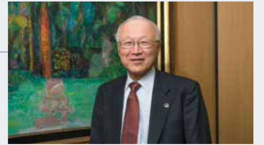
インテグラル法律事務所

1974年一橋大学経済学部卒、司法修習30期。81年、当時の所属事務所から独立。2004年にはインテグラル法律事務所を設立、現職に。専門分野は企業法務、不動産関係。趣味は健康維持のためのゴルフ、月2回コースに出ることを目標としているがなかなか果たせない。それに囲碁。座右の銘は、デルフォイ神殿に刻まれた古代ギリシアの格言「汝自身を知れ」。